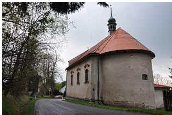
kostel sv. Anny v Modletíně

Spojení s okolními obcemi zajišťuje pravidelná autobusová doprava. Nejbližší železniční stanice Chotěboř je vzdálena 12 km. V obci není žádné vzdělávací, ani zdravotnické zařízení – zajišťují okolní obce. Vzdálenost od nejbližších složek integrovaného záchranného systému v Chotěboři je 11 km. Spádovou nemocniční péči zajišťuje 30 km vzdálená nemocnice v Havlíčkově Brodě. V obci jsou činné spolky - sbor dobrovolných hasičů, myslivci a sportovci.