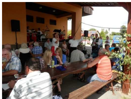
oslava přidělení praporu a znaku obce