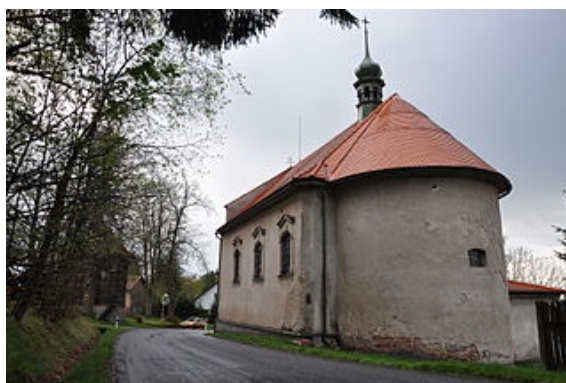
kostel sv. Anny v Modletíně

Spojení s okolními obcemi zajišťuje pravidelná autobusová doprava. Nejbližší železniční stanice Chotěboř je vzdálena 12 km. V obci není žádné vzdělávací, ani zdravotnické zařízení – zajišťují okolní obce. Vzdálenost od nejbližších složek integrovaného záchranného systému v Chotěboři je 11 km. Spádovou nemocniční péči zajišťuje 30 km vzdálená nemocnice v Havlíčkově Brodě. V obci jsou činné spolky - sbor dobrovolných hasičů, myslivci a sportovci.