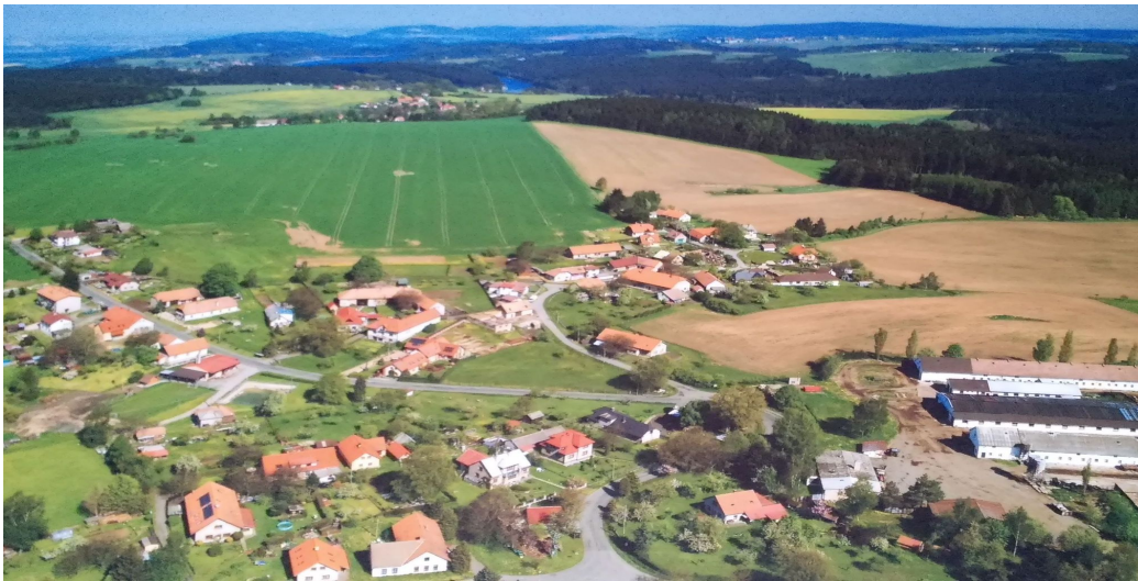
letecký pohled Rušínov

Strategický rozvojový dokument patří k základním dokumentům obce Rušínov. Vyjadřuje předpokládaný vývoj obce v dlouhodobějším časovém horizontu. Vychází z územního plánu obce a ze současného demografického, sociálního, kulturního a ekologického stavu. Jedná se o otevřený dokument, jehož hlavním smyslem je rozvoj obce, který povede k zachování její samostatnosti a prosperitě.