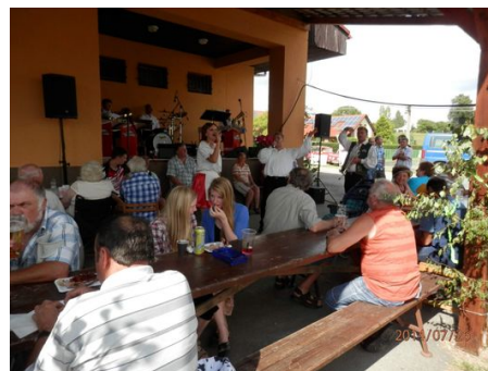
oslava přidělení praporu a znaku obce